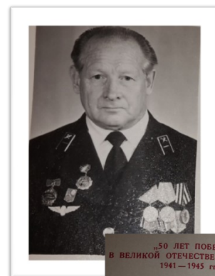
„50 ЛЕТ ПОБЕДЫ В ВЕЛИКОЙ ОТЕЧЕСТВЕННОЙ ВОЙНЕ 1941 — 1945 гг.“